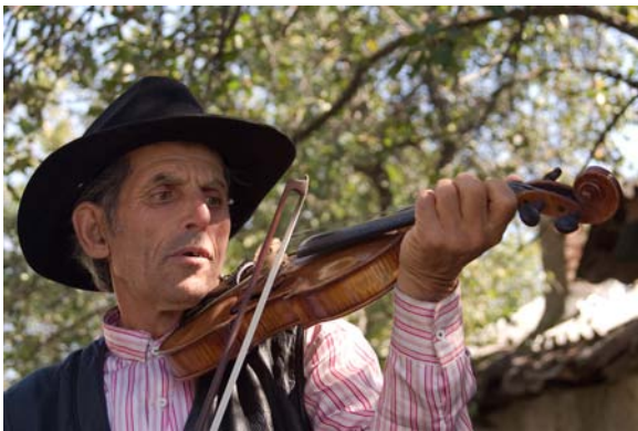
Virtuoses Geigenspiel in Clejani

Eine Besonderheit der Reise sind die vier Livemusikabende zu den verschiedenen Musikstilen. Eine Gruppe von Musikern wird uns die jeweils typische Romamusik der Gegend vorstellen. Vor- und nachher besteht die Möglichkeit mit den Künstlern ins Gespräch zu kommen. Dabei geht es nicht darum, ein klassisches Konzert zu hören, sondern vielmehr einen aufgelockerten musikalischen Abend zu erleben, Essen und Trinken inklusive. Die Musikabende werden auch für die Einheimischen offen sein. So werden wir einen unverfälschten Eindruck des dortigen Lebensgefühls bekommen.