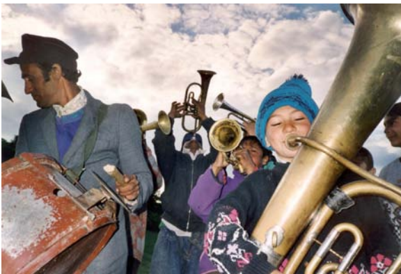
Veteranen und Nachwuchs – Blasmusiker in dem nordost-rumänischen Dorf Zece Prăjini – der Heimat von Fanfare Ciocărlia

Rumänien besitzt eine reiche traditionelle Musiklandschaft, deren Stile unter anderem von den Roma über die Jahrhunderte hinweg tradiert wurden. Das Land ist vielfältig und hat eine bewegte Geschichte zwischen Orient und Okzident durchlebt. Das äußert sich auch in der Romamusik der verschiedenen Regionen. Besonders nach dem Fall des Eisernen Vorhanges 1989/90 ist diese Art der Musik auch au-